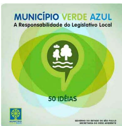
Portada de la Guía “50 Ideas” del Programa Municipio Verde Azul del Gobierno del Estado de Sao Paolo, Brasil.