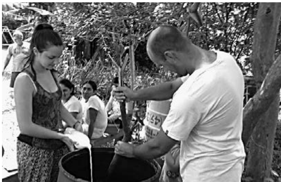
Fotografía del Archivo CEAGRO.