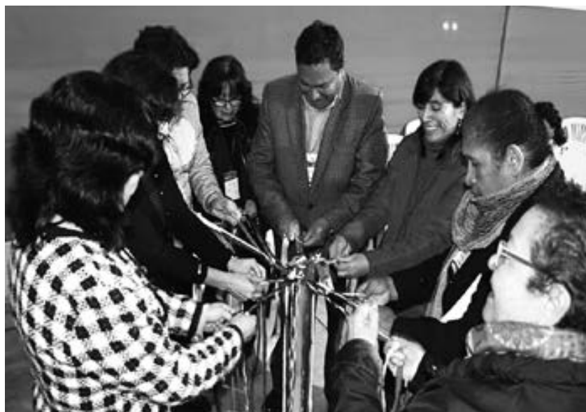
FIGURA 3. Diálogo de saberes.

Construir estrategias de educación política para potenciar nuestra identidad política y recuperar la memoria como Movimiento de Educación Popular, que es uno de los desafíos que nos hemos propuesto como CEAAL.