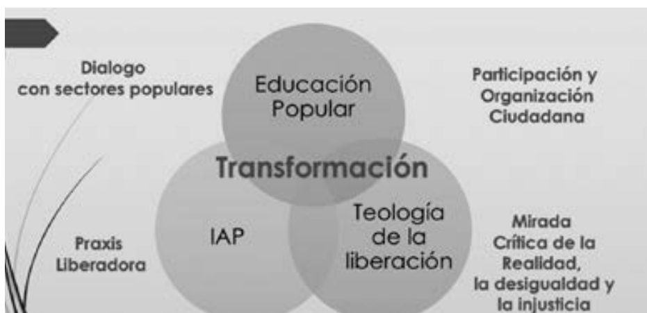
FIGURA 2. Interrelación de la Educación Popular, Investigación-Acción Participativa y Teología de la Liberación.

Si hablamos de la IAP, hablamos de investigaciones concertadas de problemáticas con las comunidades, que cuestionan las concepciones de verdad, objetividad, neutralidad, verificabilidad y predictibilidad de la concepción positivista de la investigación en la academia occidental y proponen una transformación de las condiciones y circunstancias que impiden la realización plena y autónoma de los sujetos sociales.