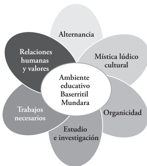
GRÁFICO 1. Dimensiones pedagógicas del curso Baserritik Mundura.

Todo ello se refleja en la propia estructura del curso, en su metodología pedagógica y en la forma de organizarlo y organizar a los colectivos que le dan vida. Existen diferentes herramientas metodológicas para construir ambiente educativo; 11 una de ellas es organizar los cursos y escuelas contemplando diferentes tiempos para trabajar diversas dimensiones educativas, tal y como muestra el gráfico 1.