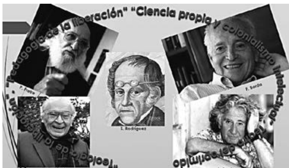
FIGURA 1. Diálogos entre la Educación Popular.