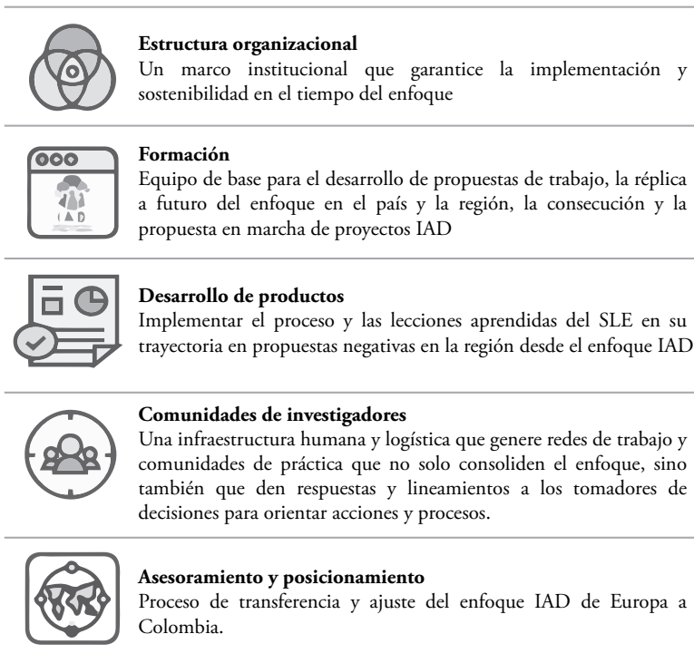
FIGURA 2. Ejes de trabajo de la fase II (2014-2017).