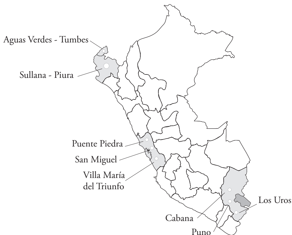
FIGURA 1. Red Nacional de Prominnats.